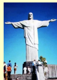
コルコバードの丘の手を広げる巨大なキリスト像は有名です。